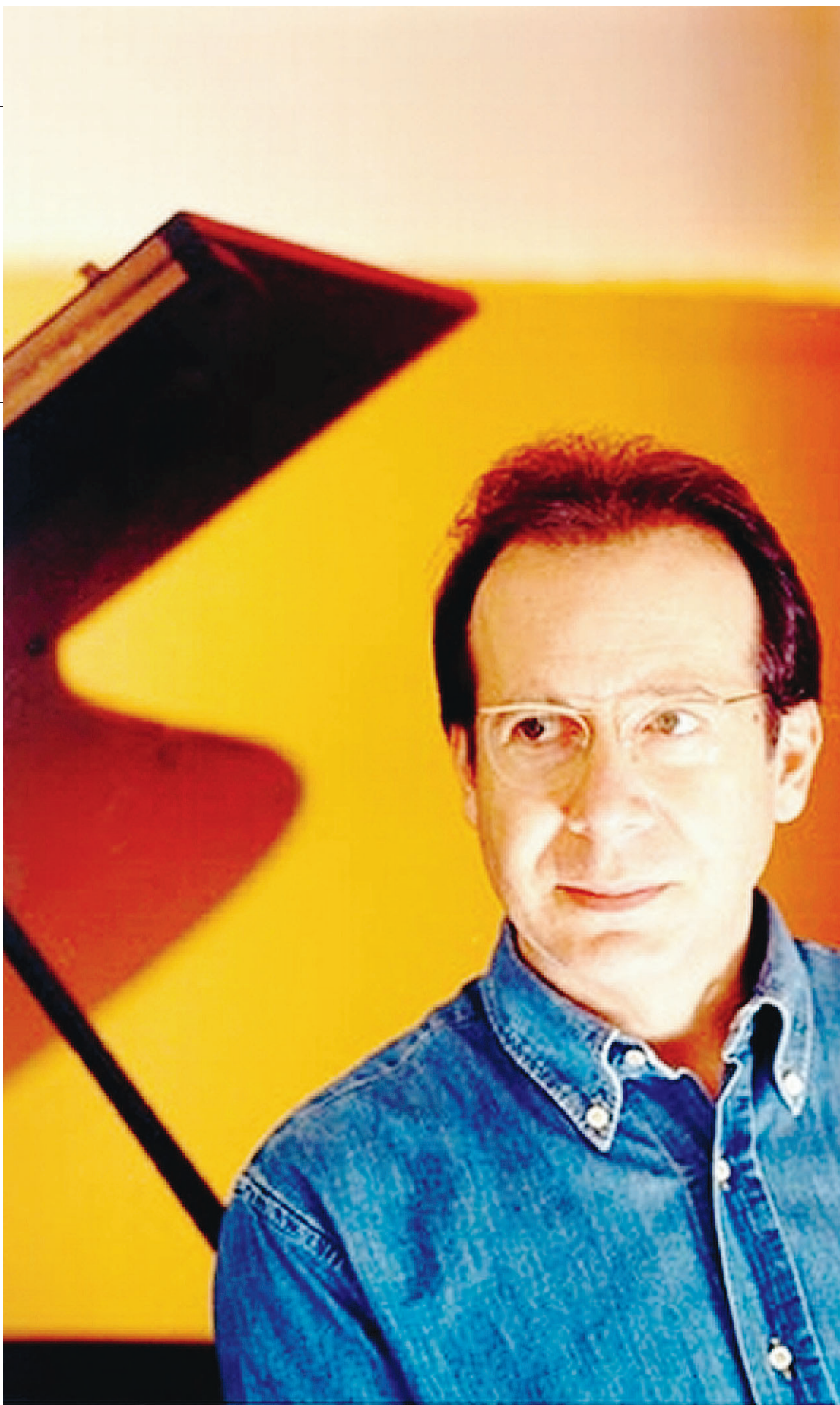
COMPOSITORE Ivan Fedele è uno dei più dotati autori di musica contemporanea del mondo